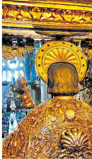
Am Ziel: Die Kopfbüste des Jakobus kann in Santiago de Compostela umarmt werden.

Harry Potters Geschichten, die ich gern gelesen habe, zeigen gerade, dass nicht das Zaubern diesen Jungen und alle seine Freunde glücklich gemacht hat, sondern allein das Wissen darum, geliebt zu sein. Alles kreist um die erlösende Liebe seiner Eltern und seiner Freunde. Darum enden diese Zauberergeschichten so scheinbar banal mit einer Szene familiärer Eintracht, bei der Harry