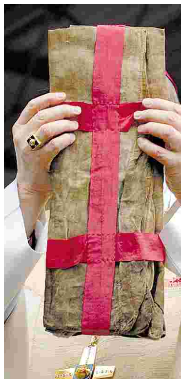
Das Lendentuch Jesu – gezeigt bei der Aachener Heiltumsfahrt.