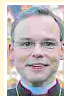
Bischof Franz-Peter Tebartz-van Elst

Die vielen Herausforderungen dieses Jahres lassen an den Wallfahrtsorten zur Schmerzhaften Mutter Gottes begreifen, wie sehr wir in allem, was belastet, zugleich getragen sind. Glaube formt sich an diesen Orten im Gebet. Hier gilt im Glauben wie im Leben: Das Kreuz prägt, wo es trägt.