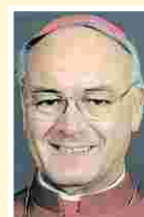
Bischof Heinz Josef Algrmisen

Lourdes – Pilger zieht es Jahr für Jahr in großen Wallfahrten an diesen Ort. Waren es nach den Erscheinungen der Gottesmutter im Jahr 1858 erst einige wenige, so sind es heute jährlich Millionen von Menschen, die sich immer wieder auf den Weg in diesen kleinen südfranzösischen Ort in den Pyrenäen machen, um dort nachzuempfinden, was dem kleinen Mädchen Bernadette Soubirous widerfahren ist.