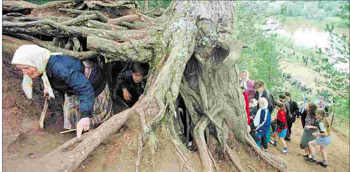
Näher am Heil: Wallfahrt in Velikoretskoye, 100 Kilometer östlich von Moskau. Mehr als Tausend Pilger verehren auf ihre Weise den heiligen Nikolaus. Seine Ikone wurde in einer Baumwurzel gefunden.