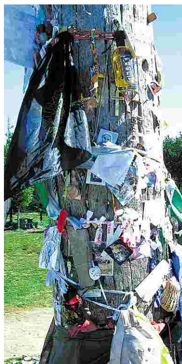
Wunschbaum von Pilgern auf dem Camino.

Potters Herz zur Ruhe gekommen ist. Aber das ist es, worum alle Sehnsucht kreist: geliebt zu sein! Die ganzen Zaubereien dieser Geschichten sind hohler Zauber gegen die Gewissheit, geliebt zu sein.